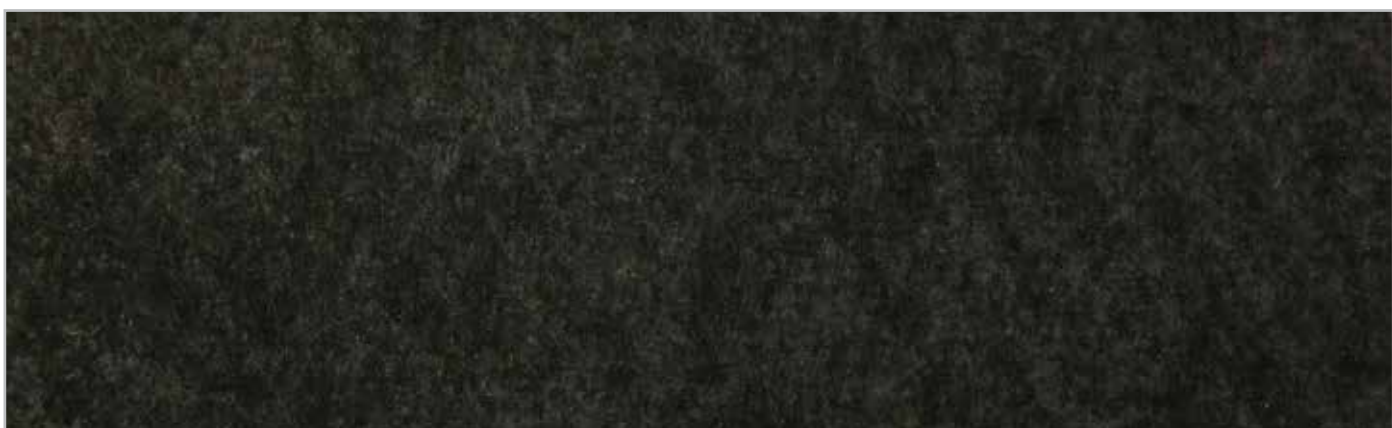
Backing - Dos - Rücken - Dorso